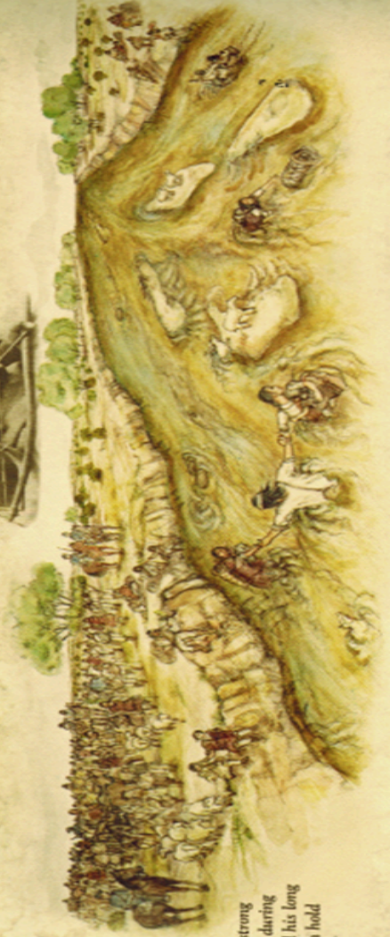
There is a Navajo story of a large, strong Navajo man that served as a forger during the river crossing. He would extend his long arms and have women and children hold on to him to cross the river.