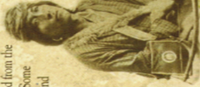
Known by the soldiers as Jim, this Navajo man survived the Long Walk.

The oral tradition of the Navajo states that there were gross acts of brutality. Stories tell that stragglers were shot and pregnant women were killed if they could not keep up with the group. Because the Navajo believed the soldiers who said that conditions would be better at the reservation, they trudged on to Bosque Redondo with hope.