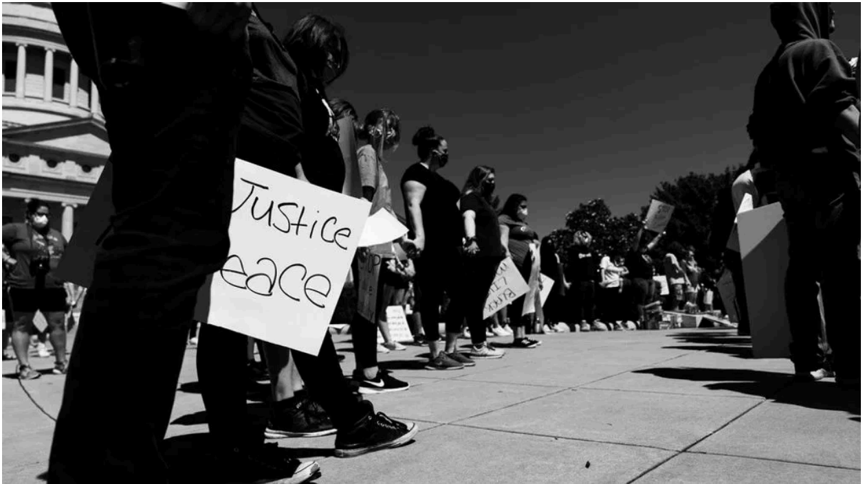
Imagen de protesta por “Engage”